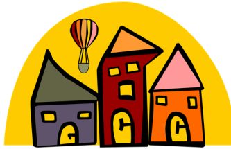
Center Gustava Šiliha Maribor

Spoštovani starši, dragi učenci in učenke!